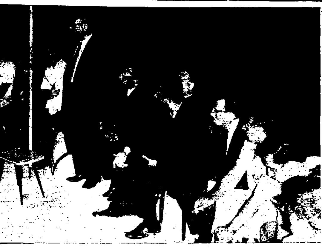
مجال جمعية الصداقة العربية - السورية يندمج الى العمل الاردني لدى زيارة الوفود العمالية للاتحاد نقابات العمال الاردنيين

مراكز التجنيد جهزت لك كل الوسائل ، تخلف منك الرجل صاحب الإرادة ، العزيمة ، الثقة وتحمل المسؤوليات . عنان - اجتمعت لجنة لتفقد المواطنين صباح امس برئاسة الدكتور سلمي جوده ورئيس ديوان المواطنين ونظرت في عدد من التماسات المقدمة الى ديوان المواطنين في شأن قرارات من بينها ترحيل لثلاثين معلوما ومعلمة والرحيل اسماويل .